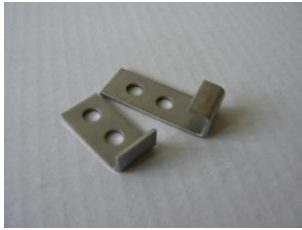
4) Krajová příchytku nerez včetně nerezových vrtů