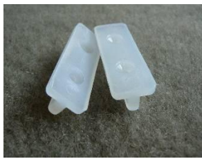
5) Průběžná příchytku plast včetně nerezových vrtů